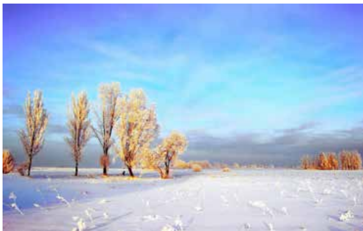
Zo zag het er uit in januari 1984

De winter van 1963 is veel besproken door de generaties boven mij (het jaar dat Reinier Paping de Elfstedentocht won en dat was behalve een erbarmelijke toch ook een verhaal op zich. Dat is hier te lezen op internet: https://nl.wikipedia.org/wiki/Reinier_Paping ).