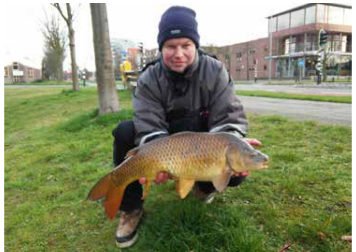
Een andere en veel zachtere winter, hetzelfde type karper iets verder op in een vijver

Maar het lukte want de vis had weinig vermogen in deze ijskoude tijd en ik hield de lijn vrij door mijn hengeltop zoveel mogelijk in het midden van het wak trachten te houden en onder water tot het derde oog vanaf de top. Dat had wel als minder handige bijwerking dat ik dus niet kon zien wat de vis deed en alles op gevoel moest doen. Maar dat is het voordeel 's winters, als de vis traag is. Toen kon ik het zelfs blijven volgen op gevoel en zo ving ik mijn eerste sneeuwkarper, tot verbazing van een passerende fietser. Nou ja, die wilde passeren maar toen de man even vluchtig naar mij keek lag hij meteen onderuit en kwam toen maar even bijkomen bij mij en om zijn fiets stuur weer recht te zetten. 'Waar komt die nou vandaan?' vroeg hij verbaasd toen hij de karper in het net en een kuil met sneeuwmuren zag liggen.