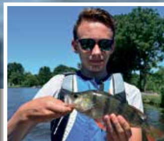
Vis vanuit een coole boot

Eten, drinken en alle materialen worden verzorgd!