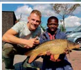
Maak materialen voor karpervissen