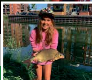
Leer goed vissen