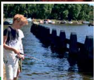
Krijg tips van ervaren vissers