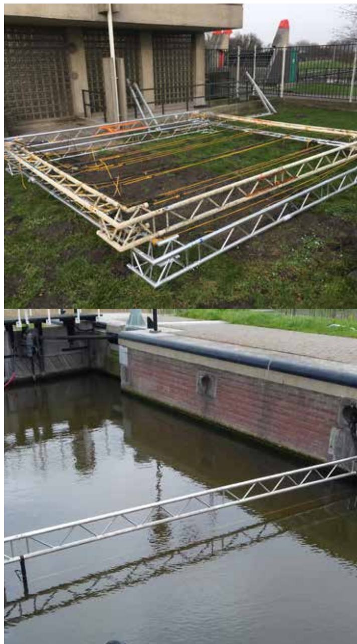
Bovenstaand een foto van de constructie van de antennes.