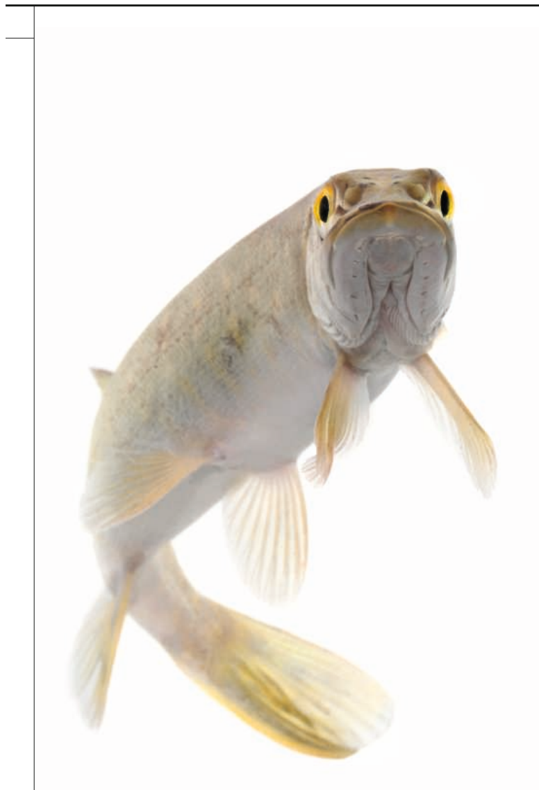
'Hij kijkt je aan met een blik die zegt: wat moet je?'